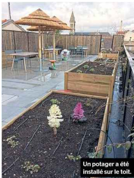
Un potager a été installé sur le toit.