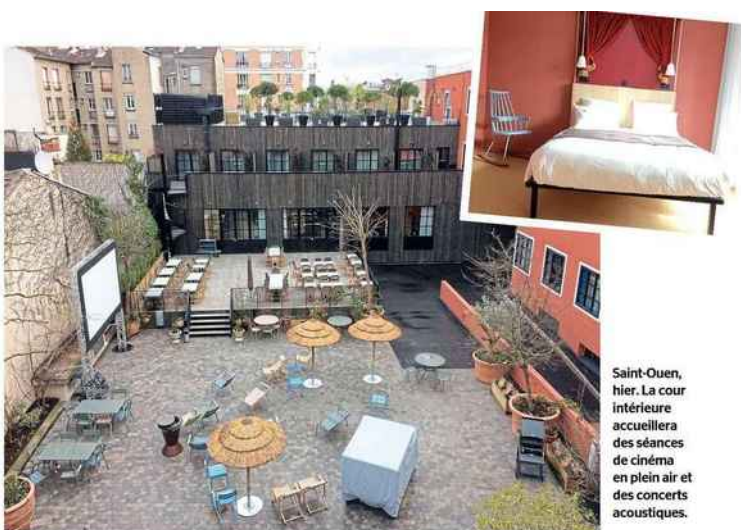
Saint-Ouen, hier. La cour intérieure accueillera des séances de cinéma en plein air et des concerts acoustiques.