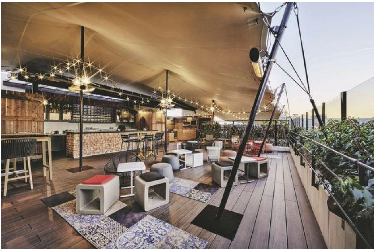
La terrasse du café sur le toit du Generator Paris, place du Colonel Fabien dans le Xe arrondissement.

>> A lire aussi >> 10 chambres qui donnent envie de se relaxer