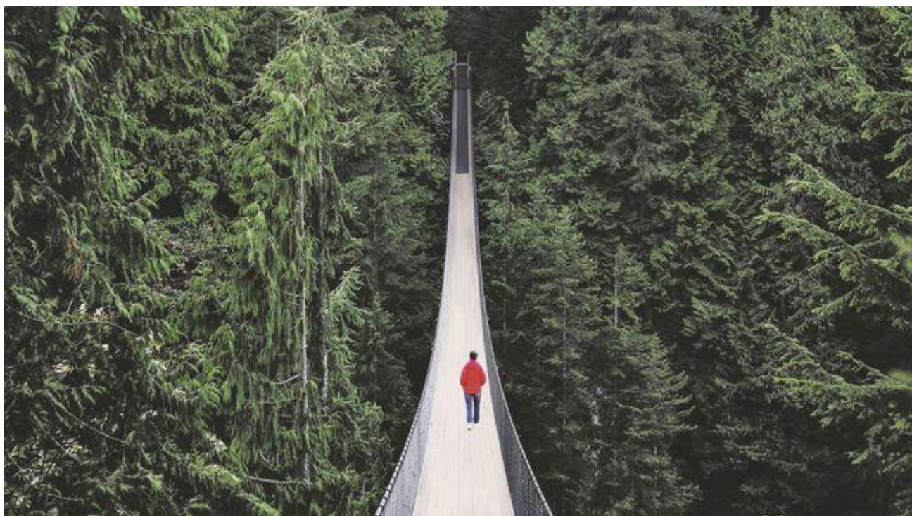
Les nouveaux horizons du voyage